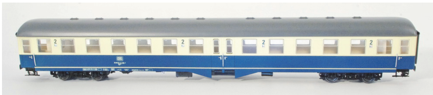
Foto zeigt Handmuster

Terminplanung: 1:43,5 Modelle im Sommer 2013 und die 1:45 Modelle im Winter 2013. Bitte bestellen Sie vor. Dies sind keine Umbauten aus Rivarossi-Wagen sondern komplette Neuanfertigungen.