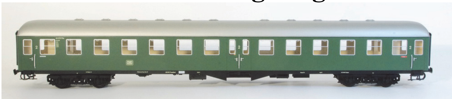
Foto zeigt Handmuster.

Wir fertigen für Sie, als Kunststoffpräzisions-Modell, vier unterschiedliche Modelle: 1x A/B-Wagen, 2x B-Wagen mit unterschiedlichen Betriebsnummern sowie 1x Steuerwagen in den Epochen 3 und 4.